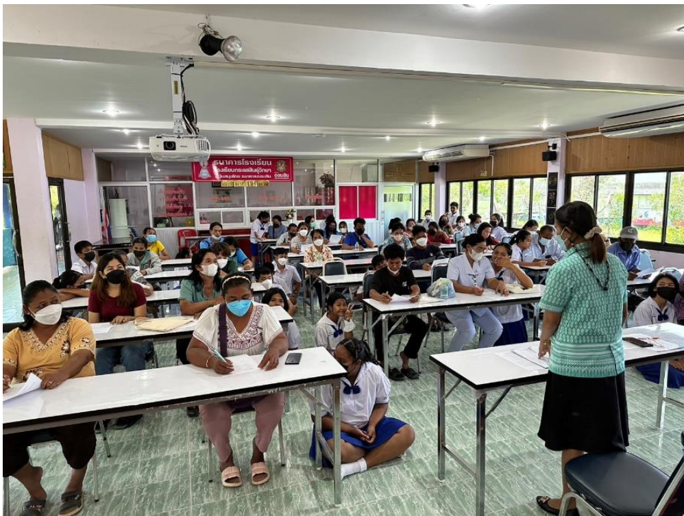
ครูที่ปรึกษาบปะผู้ปกครองในชั้นเรียน