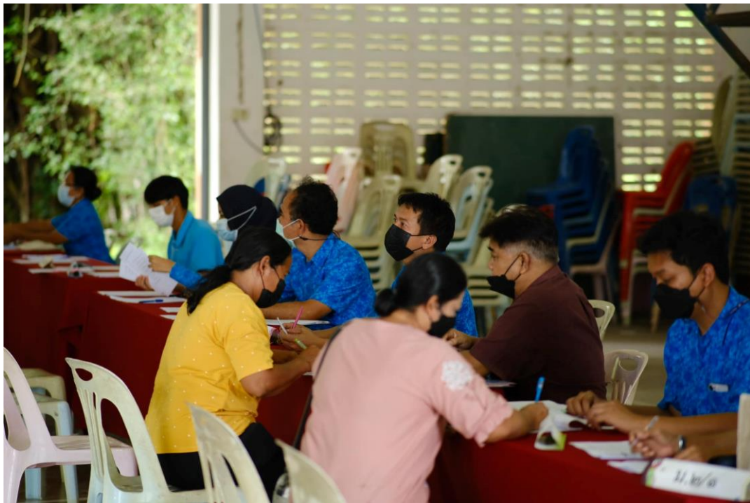
ครูที่ปรึกษารับลงทะเบียนการประชุมผู้ปกครอง