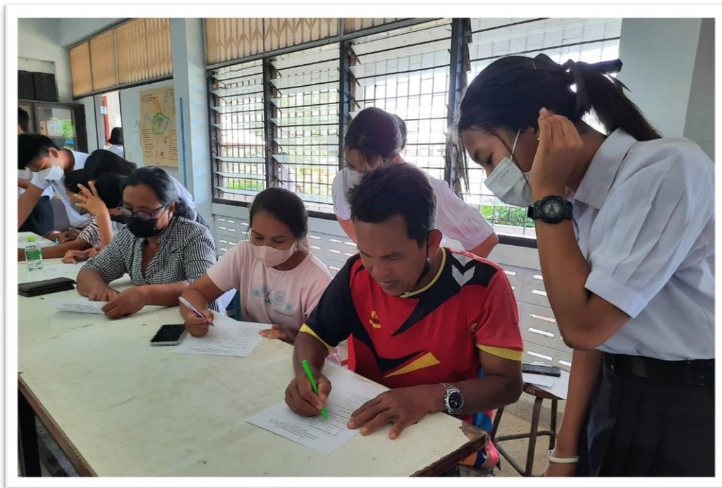
ผู้ปกครองรับทราบผลการเรียนและทำแบบประเมินความพึงพอใจ