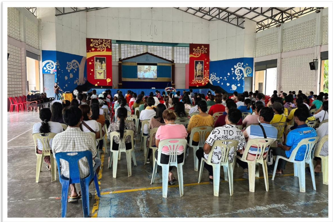
บรรยากาศการประชุมในหอประชุม