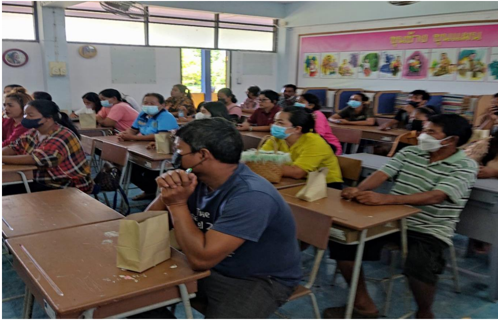
การเปิดโอกาสให้เกิดการมีส่วนร่วม กิจกรรมการประชุมผู้ปกครอง