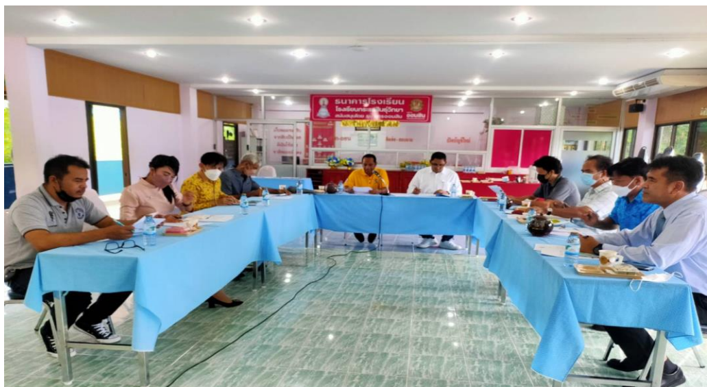
ประชุมการมีส่วนร่วมของคณะกรรมการสถานศึกษาโรงเรียนกระแสนิวัตวิทยา