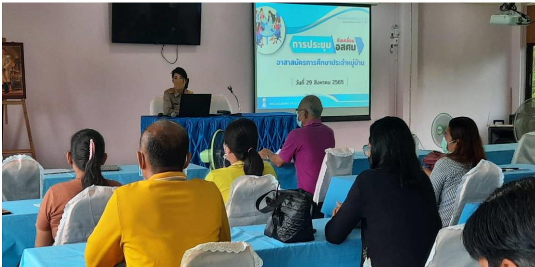
การเปิดโอกาสให้เกิดการมีส่วนร่วม กิจกรรมการประชุม อาสาสมัครการศึกษาประจำหมู่บ้าน